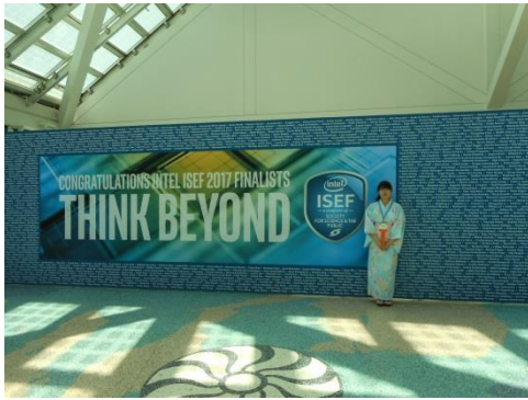
すべてのファイナリストの名前がボードに載せられています。