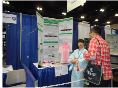
来られた多くの人に研究の説明ができました。