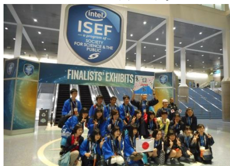
日本代表チームの皆さんです。