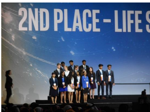
グランドアワード 優秀賞2等を受賞しました。