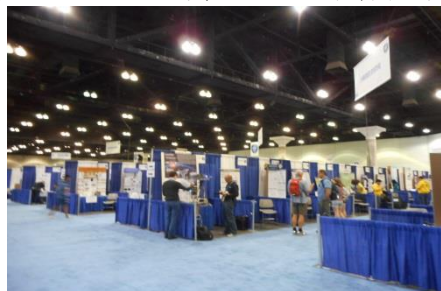
とても大きな会場です。